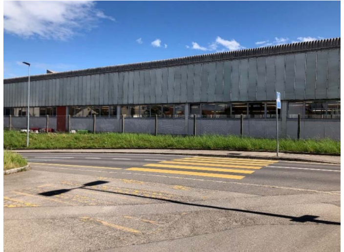
Passage pour piétons existant