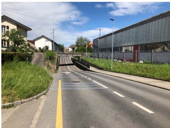
Visibilité côté centre-ville