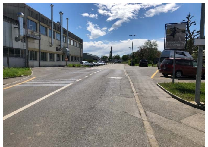
Visibilité côté Moudon