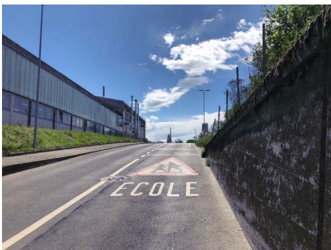
Visibilité du conducteur