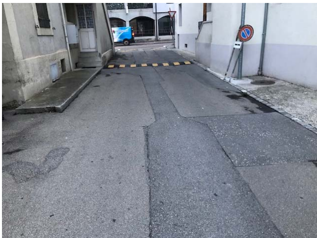
Figure 3 : Etat existant du revêtement routier

De par l'importance de la fouille, nécessaire à la réalisation des nouveaux collecteurs, en présence de diverses conduites existantes et à une profondeur non négligeable, l'entier de la surface de l'impasse sera remis à neuf (DP). Cela évitera de conserver des moignons de revêtement, qui plus est dans un état insatisfaisant.