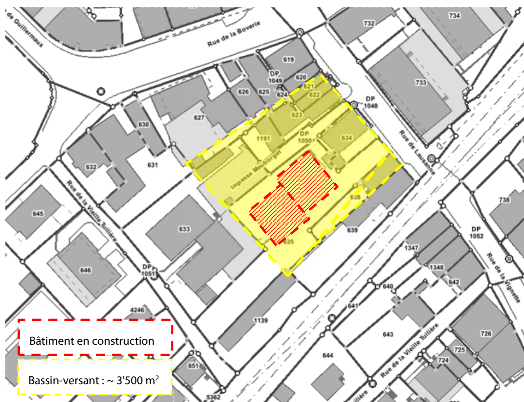
Figure 1 : Périmètre du projet

Une évaluation du bassin versant et le dimensionnement des collecteurs ont été demandés au bureau d'ingénieurs Kung & Associés SA, co-auteur du PGEE communal.