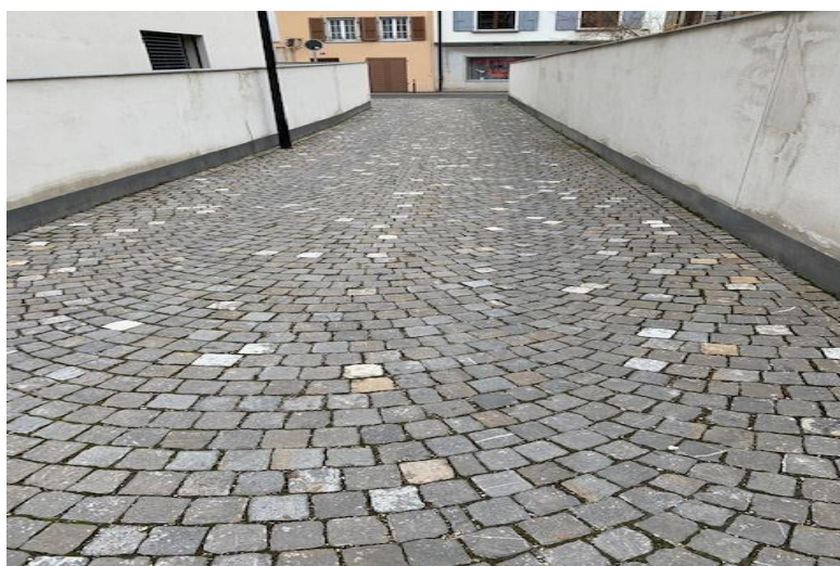
Exemple rue Montpellier

Les travaux se réaliseront en principe dès avril 2021.