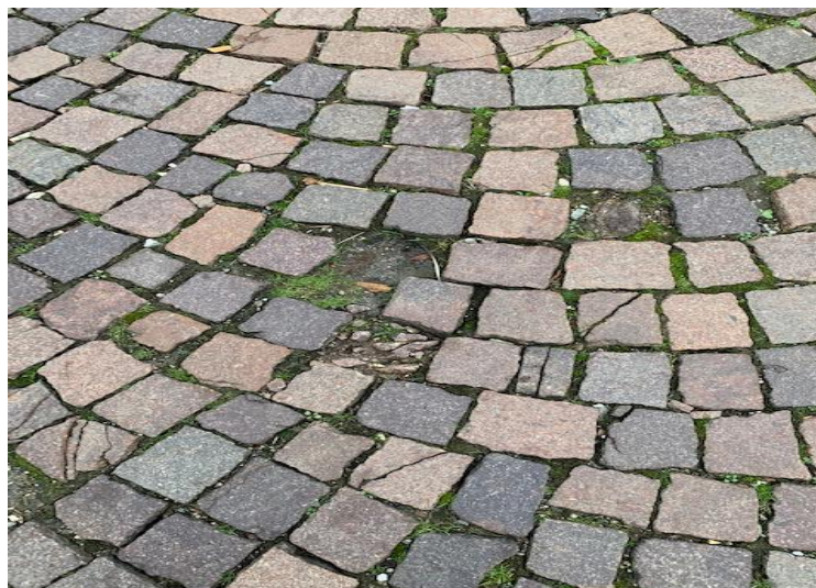
Pavés enfoncés, déchaussés ou fendus

Dans la région, il n'y a pratiquement pas d'entreprise spécialisée dans le pavage. De ce fait, une seule offre a été demandée, étant donné que cette entreprise présente de bonnes garanties et que la collaboration avec elle a toujours été satisfaisante.