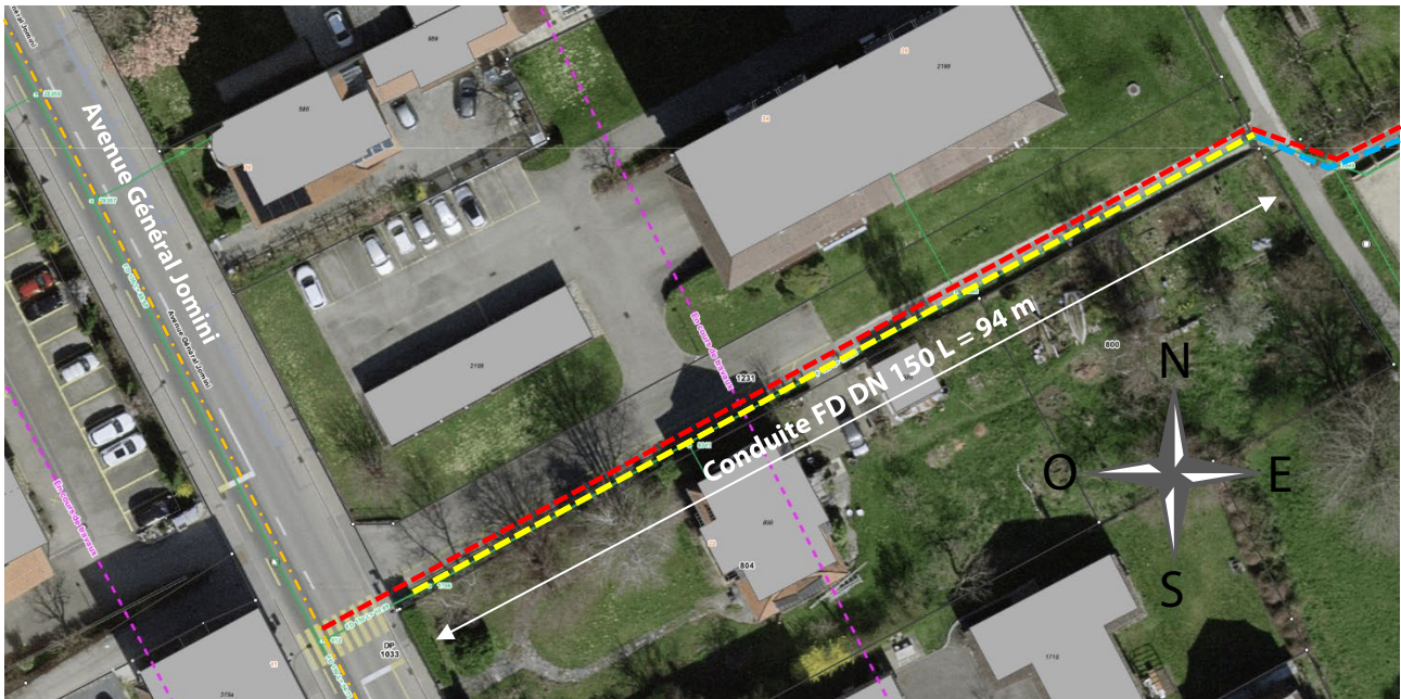
Figure 2 : Situation du projet à l'Avenue Général Jomini