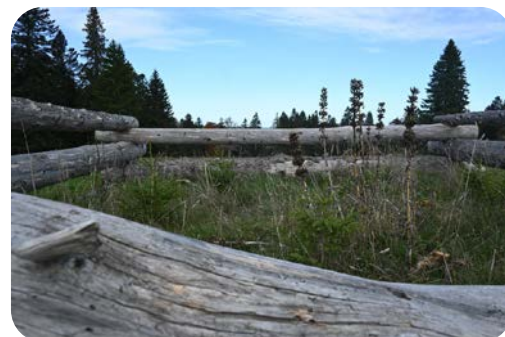
Enclos et plantations d'épicéas réalisés en 2018, Pâturage des Auberges (alt 1250 m). Aujourd'hui, le choix des essences aurait été différent !