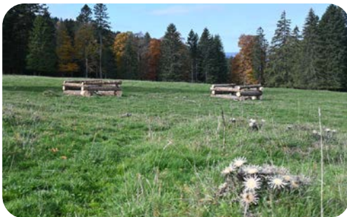
Enclos de protection réalisés en octobre 2022, sur le pâturage des Auberges, Provence.

En faisant l'effort de regarnir ses pâturages de jeunes arbres, la Commune de Payerne participe à l'entretien du paysage jurassien, en l'adaptant aux conditions climatiques à venir. Elle met en place les arbres qui dans le futur permettront au bétail de se mettre à l'ombre, quand le soleil se fera trop mordant.