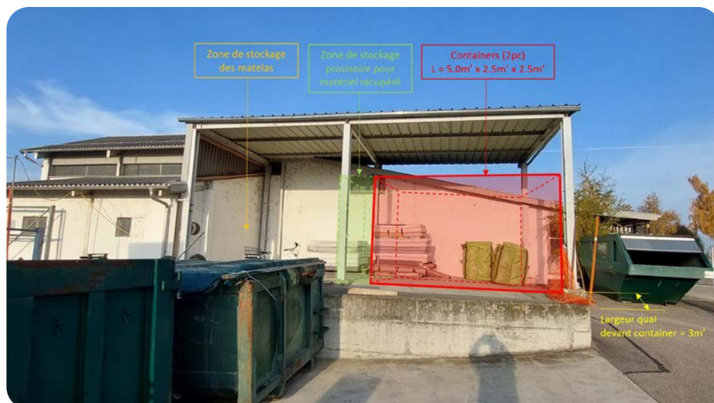
Implantation prévue de la ressourcerie au niveau de l'ancien four d'incinération

Plus d'informations... Service Infrastructures et mobilité ☎ (+41) 26 662 65 30 travaux@payerne.ch