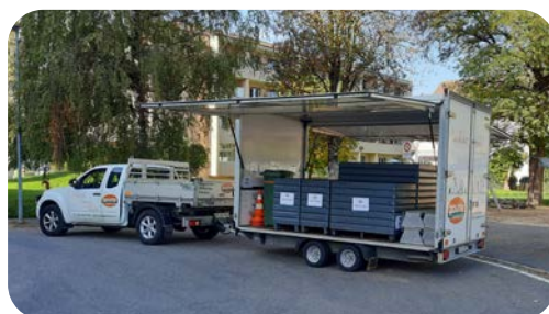
Exemple de déchetterie mobile

Ce concept pourra très facilement s'adapter si nécessaire, aussi bien en terme de sites que d'horaires.