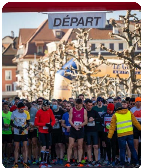
Footing - mardi 18 h 45

Créée en 1980, l'esprit qui y règne est très particulier. Ce groupe est fait pour les débutantes, adeptes du sport de détente, motivées par le but de bouger et d'améliorer sa condition physique et son hygiène de vie et par conséquent son bien-être.