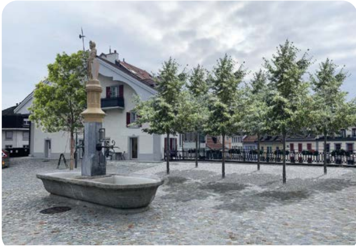
Fontaine du Banneret sur la Place du Marché

Afin de mettre en valeur la Place du Marché d'une part et, d'autre part, de répondre à la problématique liée aux îlots de chaleur, la Municipalité a décidé de réaménager l'espace gravelé de la Place du Marché par la mise en place d'un espace arborisé.