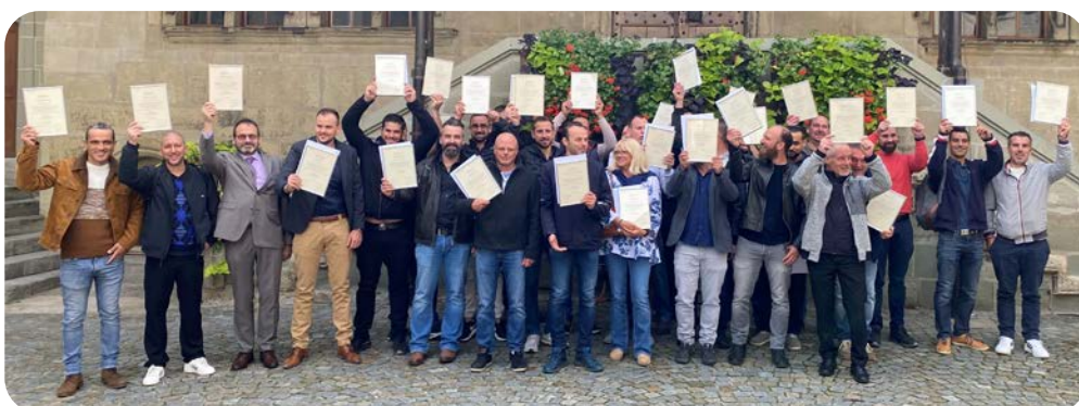
La nouvelle volée de fontainiers avec leurs brevets fédéraux

La partie officielle s'est quant à elle déroulée à la salle du Tribunal où les brevets ont été remis aux 30 nouveaux fontainiers.