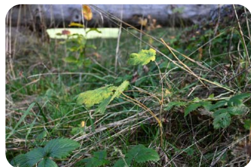
Jeune érable sycomore issu du semis de 2020, aux Auberges.