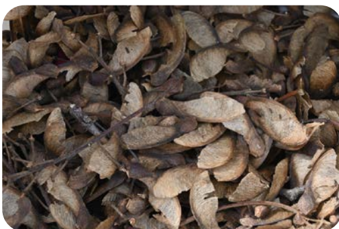
Samarses d'érable sycomore adaptés aux conditions locales, récoltés par le garde forestier.