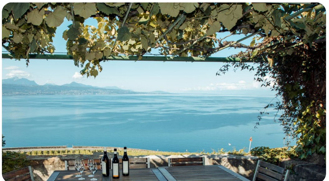
Terrasse du Château de Montagny