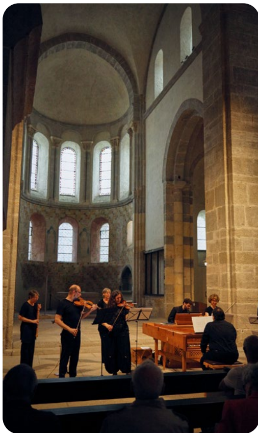
Teaser de « Lotario » donné dans l'Abbatiale en 2023

Fidèles à la mission pour laquelle ses membres s'engagent, celle de contribuer au rayonnement de Payerne et de son centre historique par une vie musicale riche, les différentes associations culturelles autour de l'Abbatiale de Payerne s'unissent pour la mise en valeur du site historique et organisent un opéra à ciel ouvert avec six représentations du 12 au 20 juillet 2024.