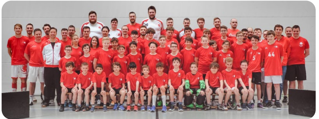
Unihockey Club Payerne 2022 - 2023

Le unihockey, Floorball dans le reste du monde, possède un fort potentiel de croissance dans la région payernoise et broyarde étant donné le faible investissement nécessaire au niveau de l'équipement et du fait qu'il n'autorise pas les contacts violents. Il est donc tout à fait adapté pour des enfants, adolescentes et adolescents et adultes cherchant un sport d'équipe dynamique et facile d'accès. C'est pour cela que le Unihockey Club Payerne met tout en œuvre pour ouvrir ses portes à toutes et tous.