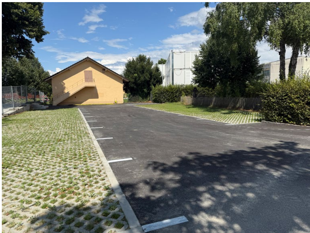
Parking des Rammes désimperméabilisation

Dans cette optique, la Commune de Payerne a mis en place des subventions pour encourager la désimperméabilisation des sols sur les parcelles privées. Des aides cantonales sont également disponibles.