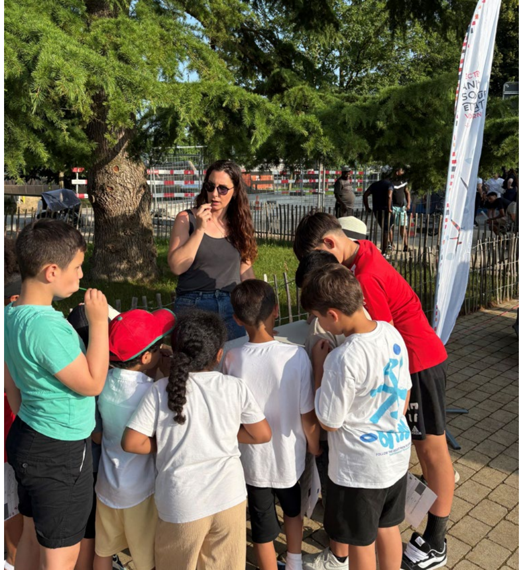
Stand lors de la Fête multiculturelle de l'établissement primaire de Payerne

En conclusion, cette invitation symbolise une véritable collaboration au service de l'enfance et de la jeunesse. Une démarche pertinente qui répond également aux enjeux liés à l'intégration car elle permet d'imaginer la diversité comme une opportunité de rencontre, de compréhension mutuelle et de célébration.