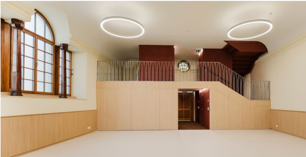
Rénovation de l'ancienne église située au Chemin Neuf 7