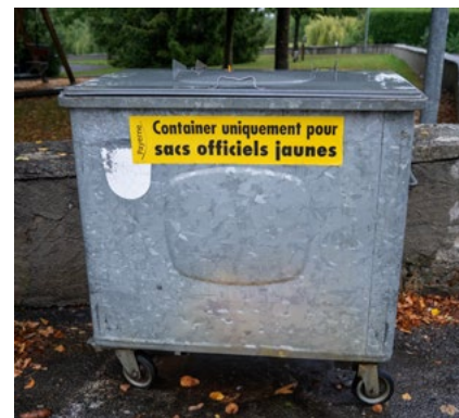
Conteneur pour les sacs officiels jaunes