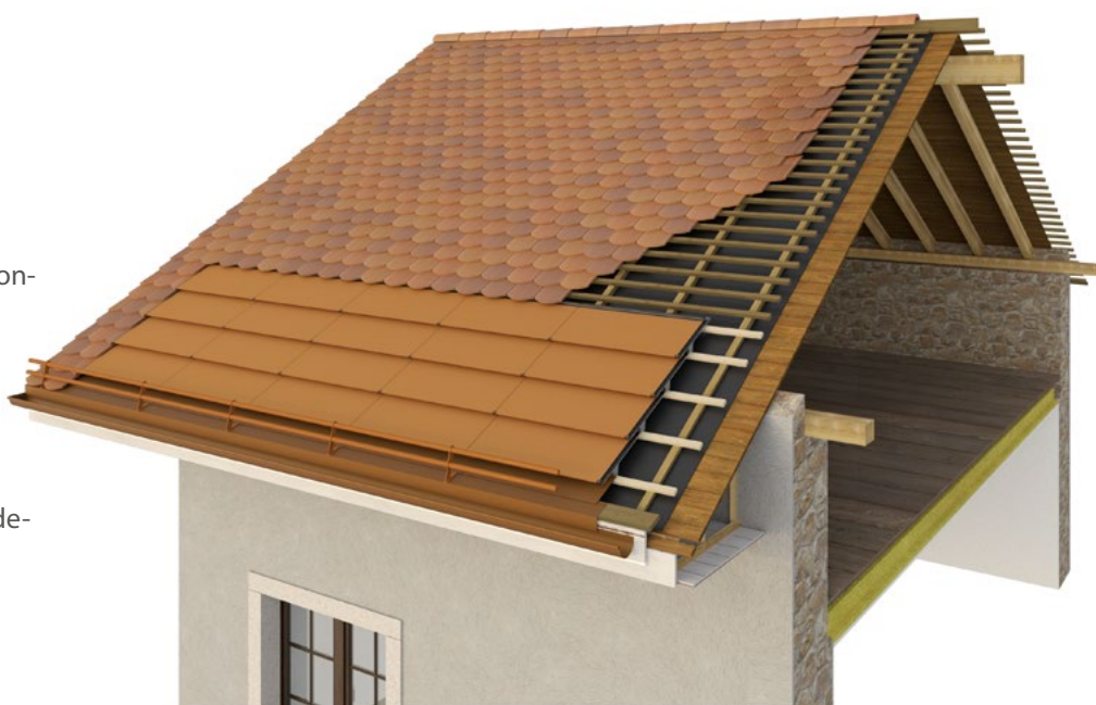
Exemple de détail préconisé

www.payerne.ch/wp-content/uploads/2025/08/modelisation-toitures.pdf