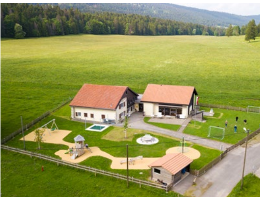
Vue aérienne de la colonie des Cluds avec sa nouvelle place de jeux