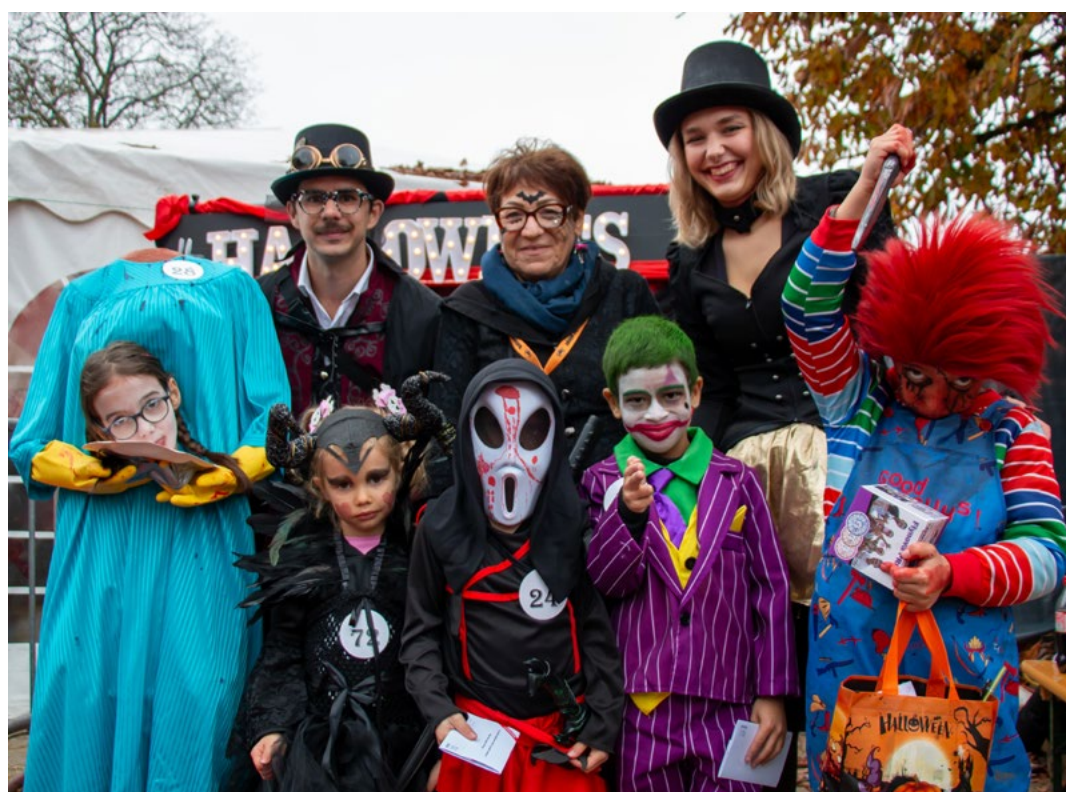
Photo Hallowings 2024

Plus d'informations sur #hallowingsPayerne