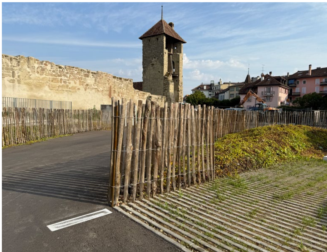
Parking des Deux-Tours désimperméabilisation

La ville éponge propose un modèle d'urbanisme plus durable, qui vise à retenir, infiltrer, stocker et réutiliser l'eau de pluie. Il permet de mieux s'adapter aux changements climatiques (épisodes de fortes pluies, canicules, épuisement des ressources en eau) et d'améliorer le confort thermique en ville.