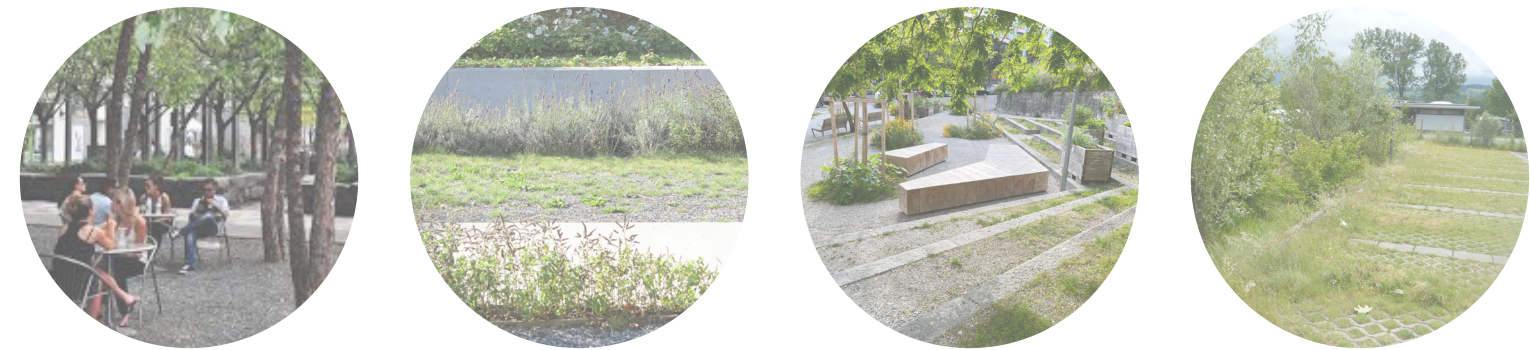
Le square de la gare UN ESPACE D'ATTENTE VÉGÉTALISÉ À PROXIMITÉ DES QAIS

ABRI BUS OFFRIER UN ABRI POUR LES JOURS DE PLUIE