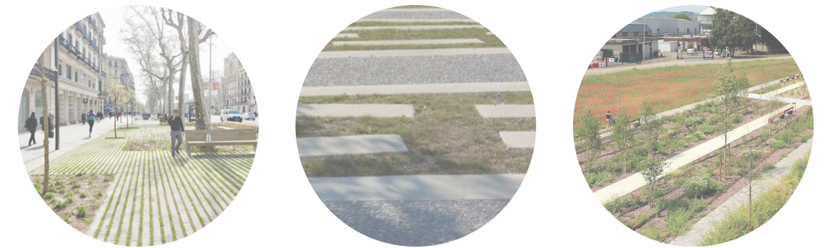
Le parvis de la gare LE PARVIS DE LA GARE COMME PORTE D'ENTRÉE SUR LA VILLE DE PAYERNE