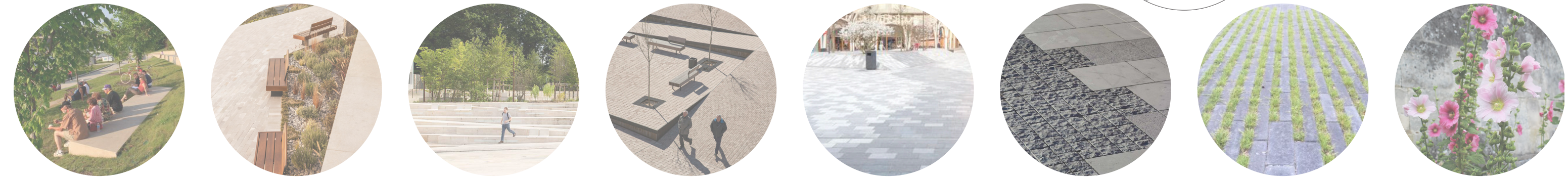
La place de la gare LA PLACE DE LA GARE FONCTIONNELLE ET SOIGNÉE